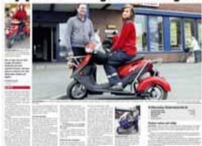
PRØVEMODELL: Romerikes Blad 26. april 2008.